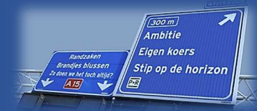
Opstarten van het bestuursteam

Stichting WijkSport rapporteert elk kwartaal over de exploitatie en resultaten, in een interactief overleg met de wethouder Sport en beleidsambtenaren. Daarnaast is er viermaal per jaar een strategisch overleg tussen de wethouder Sport en de voorzitter van Stichting WijkSport. Vanzelfsprekend verkennen bestuur en werkorganisatie van SWS continue ook overleg en samenwerking met andere partners, zoals Stichting Binding voor de link met het maatschappelijk domein.