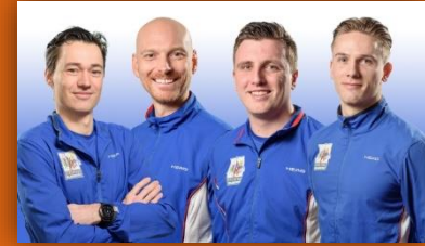
Buurtsportcoaches, brengen mensen in beweging